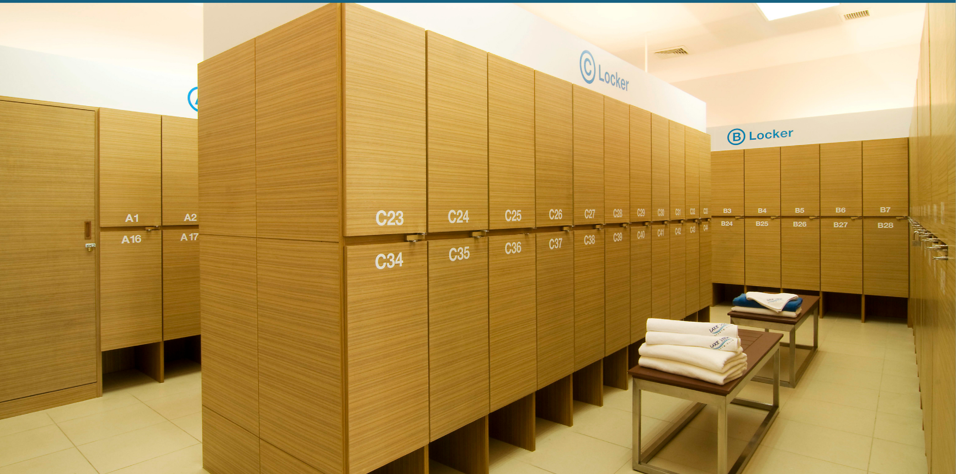
Locker Room ขนาดใหญ่แยกชาย- หญิง และห้องอาบน้ำแยกชาย- หญิง พร้อมเครื่องใช้ทั้งผ้าเช็ดตัว, ใต้อุปกรณ์